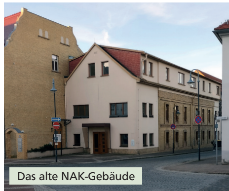
Das alte NAK-Gebäude